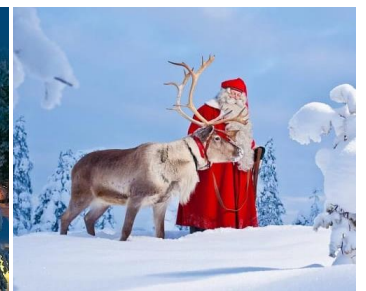
「フィンランド ラップランドにあるサンタクロース村」

キリスト教精神に基づいた本園の教育では、自分らしさを大切にしながら、まわりの人々・動植物・自然にも愛を持って接することができる人間に育てて欲しいと願っています。