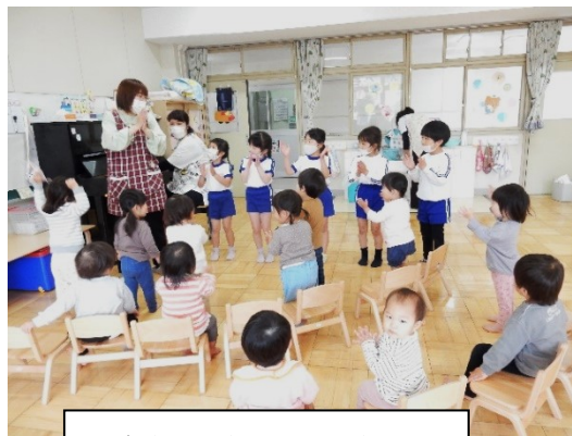
ぺんぎん組・りす組の礼拝（年長組お手本）

そしてこのように異年齢で触れ合うことの積み重ねは、お互いを思いやる心を醸成する大切な機会ともいえます。お友だちとけんかをするこもある年長さんも、1、2歳児の前では自然な形でやさしい笑顔でお世話をすることができていますから。